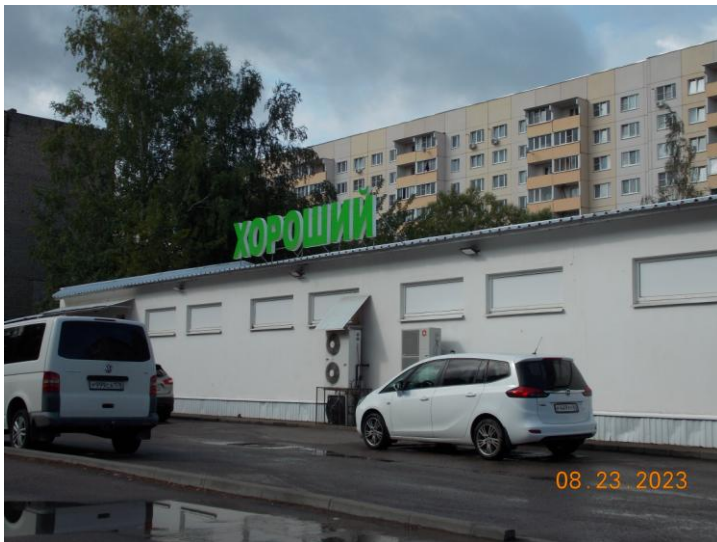
г. Великие Луки, ул. Вокзальная, 9а