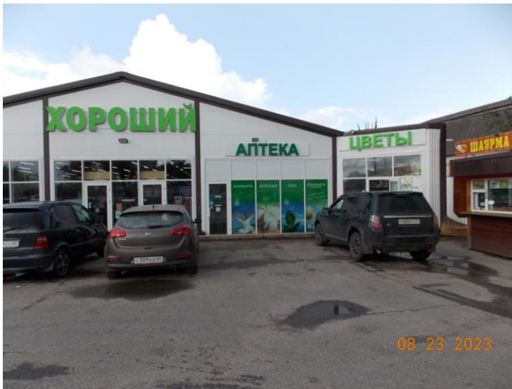
г. Великие Луки, ул. Щорса, 18