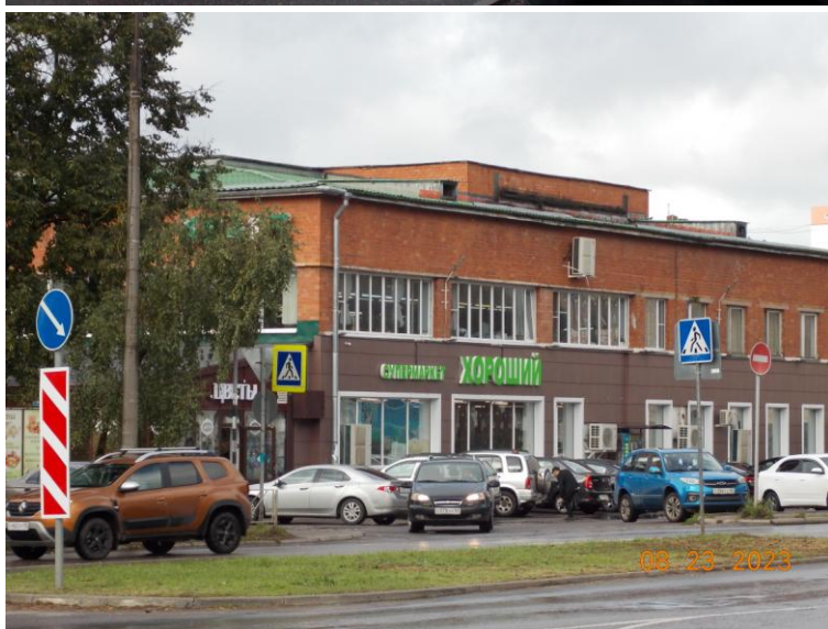
г. Великие Луки, пр. Октябрьский, 12