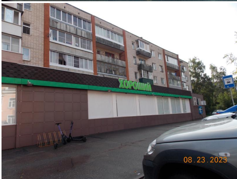
г. Великие Луки, ул. Рабочая, 5