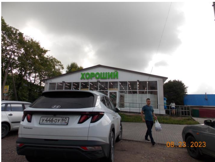
г. Великие Луки, ул. Кузьмина, 18а