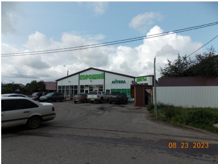
г. Великие Луки, пр. Октябрьский,