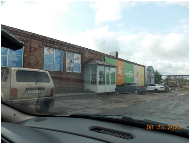
г. Великие Луки, пр. Октябрьский, 56а