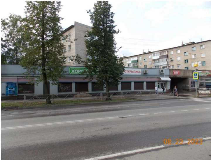
г. Великие Луки, пр. Гагарина, 44