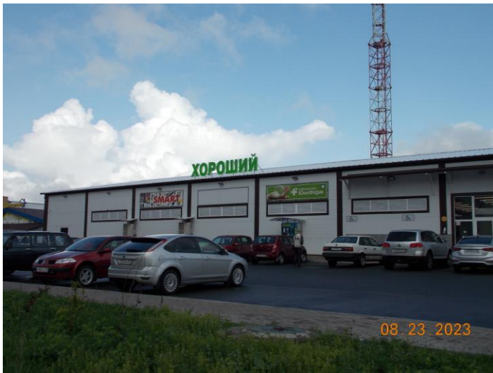
г. Великие Луки, ул. Дружбы, 10а