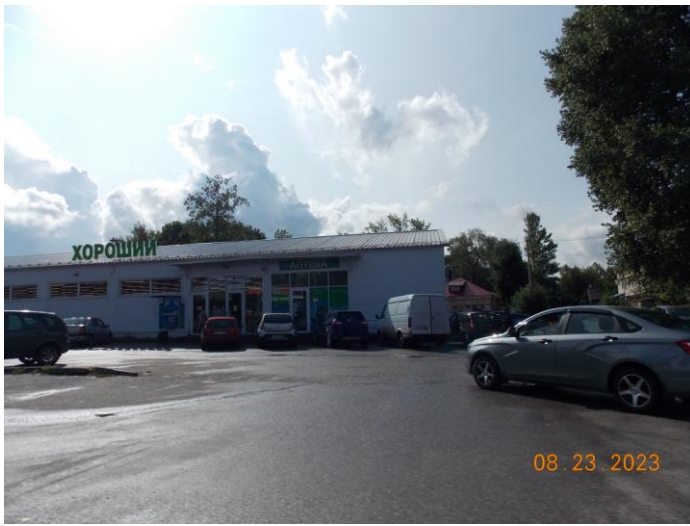
г. Великие Луки, пр. Гагарина, 114