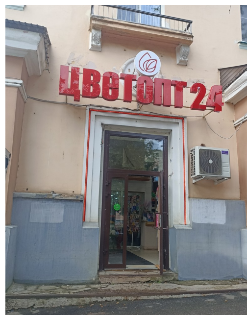
13.10.2023г. Великие Луки, пр. Ленина, д. 30/9