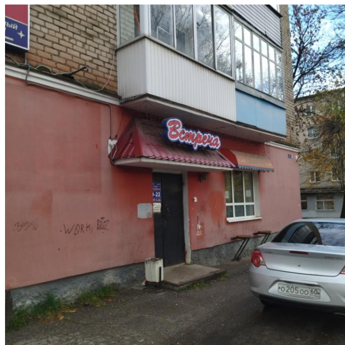
24.10.2023г. Великие Луки, ул. Стадионная, д. 10